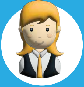
إدارة الموظفين Employee Management