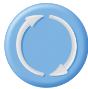
استرجاع نسخ احتياطية Restore backups