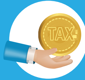
إدارة الضرائب Tax Administration