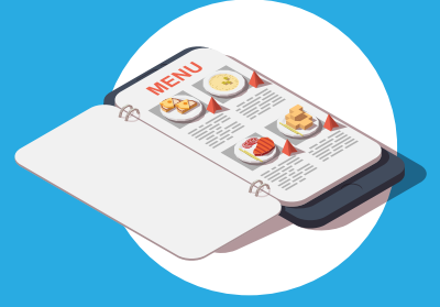
إدارة قوائم الطعام Manage menus