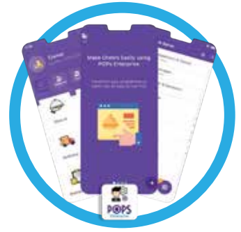
بوس المطاعم + POPs Restaurant +