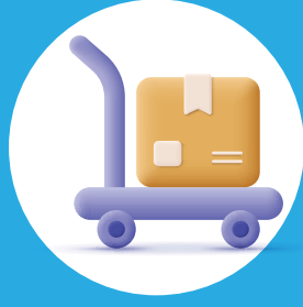
إدارة المشتريات Procurement Management