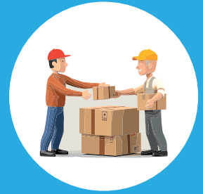
إدارة الموردين Supplier Management