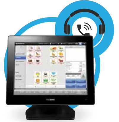
بوس مراكز الاتصال POPs Call Center