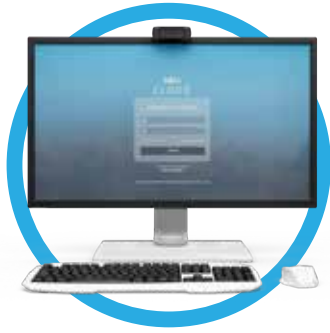
بوس كلاود POPs Cloud