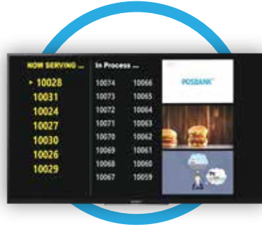
بوس كي يو دي اس POPs QDS