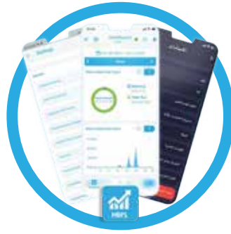
بوس الإدارة POPs Management