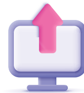
رفع نسخ احتياطية Upload backups