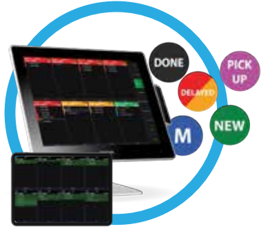
بوس كي دي اس POPs KDS