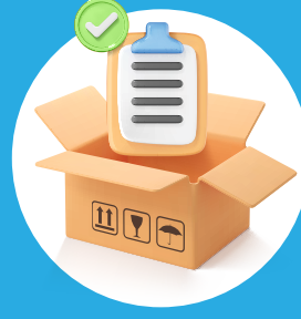
إدارة المخزون Inventory Management