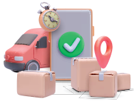
ارسال حالة الطلب عبر الواتساب Order status Via WhatsApp