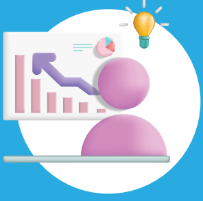
إدارة المبيعات Sales Management