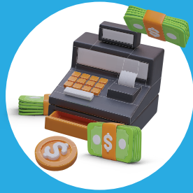
إدارة الوحدات النقدية Cash Unit Management